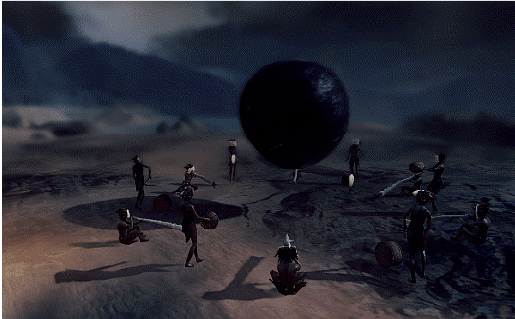
From Dust. Éric Chahi, Ubisoft Montpellier, Ubisoft, Ubisoft Kiev, 2011

entendimiento. Desaparece la trascendencia en la fe o el arte, la divinidad es mundana. La ciencia y la filosofía conquistan el lugar que antes tuvo la religión. El arte y dioses griegos se convierten en una mera idealización.