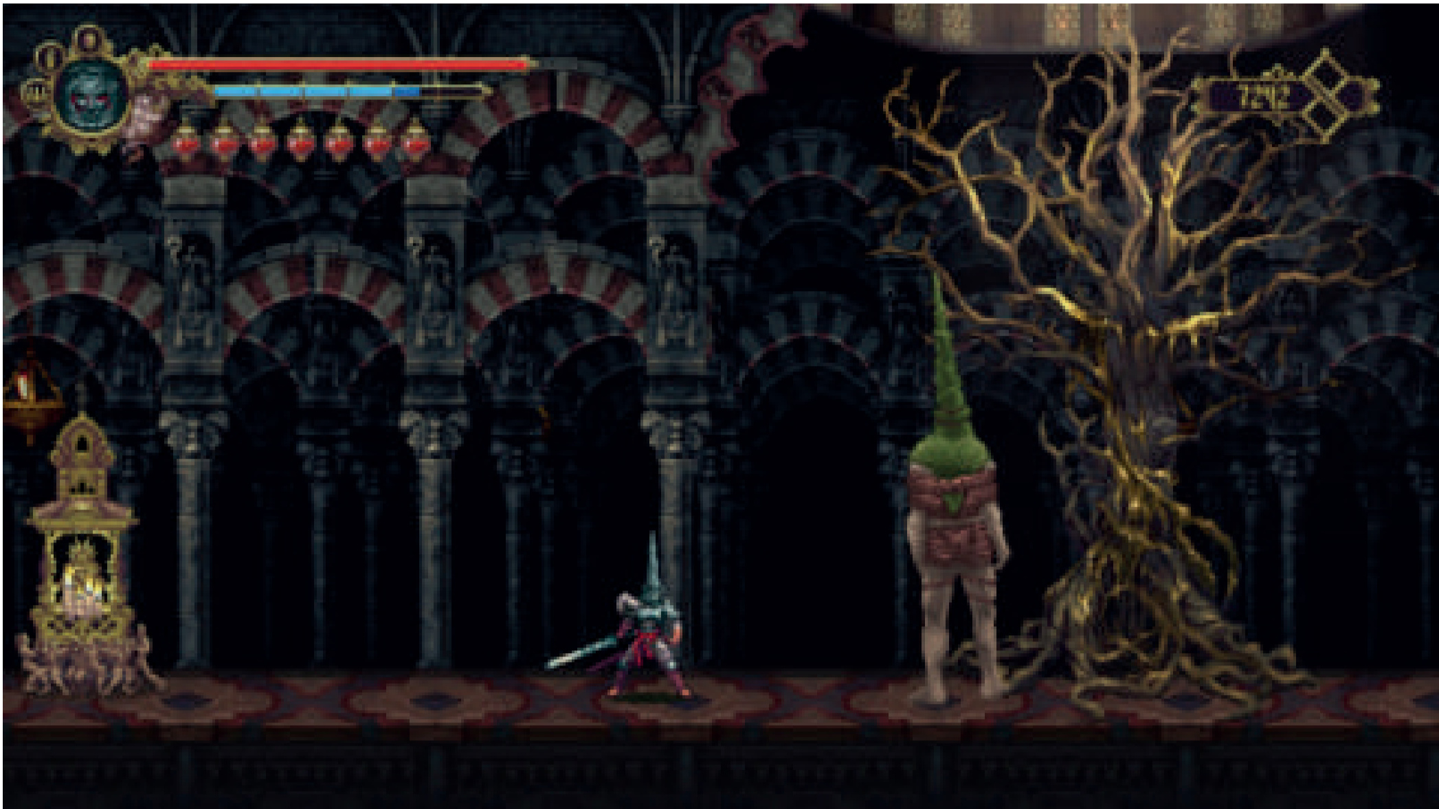
Blasphemous, The Game Kitchen, 2019

una imponente fuerza vital. La ornamentación nórdica es hibridada entre influencias contrastadas hasta llegar con fuerza al punto sobrenatural. La expresión del arte gótico llega a ser independiente de la vida del hombre y posee valores inmateriales, es decir, espirituales. La representación de animales o plantas es una mezcla de la línea abstracta con la percepción de la realidad.