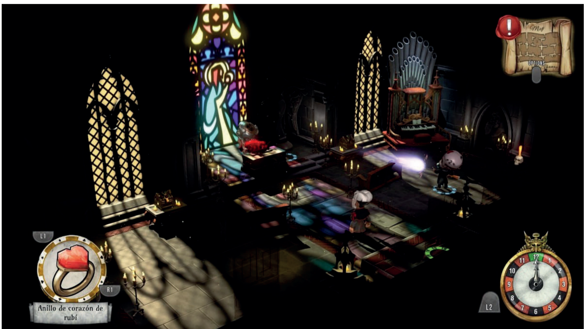
The Sexy Brutale, Tequila Works, Cavalier Game Studios, 2017

El acontecer del juego ocurre en día sábado. Se hace referencia al vudú, la magia negra y al pecado. Al resolver cada etapa, es decir, a quienes has salvado te dan su máscara y su poder. El uso de la máscara otorga el aumento de la percepción, habilidades especiales y es una fuente incontrolable de misterio en el juego. La temática del juego se basa en la trascendencia, vivir la vida, abandonar los recuerdos tortuosos. Uno de los mensajes al final del videojuego es "Dejar marchar no significa olvidar".