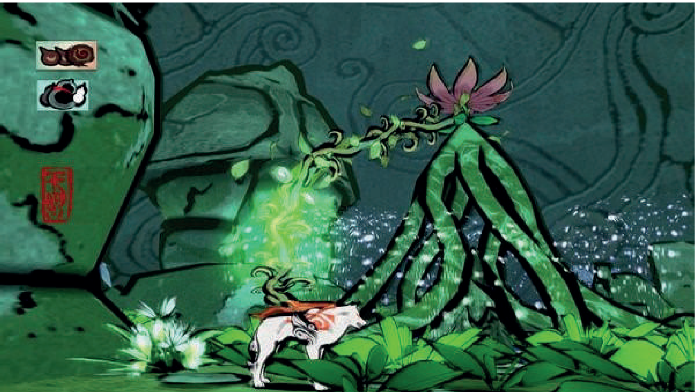
Ōkami, Hideki Kamiya, Capcom, Clover Studio, Ready at Dawn Studios, HexaDrive, 2006

de la xilografía. El lenguaje del juego llega a ser poético, percibido más que lo puramente visual, parte importante del juego es mostrar la conexión con el paisaje y con el plano de los dioses. La mayoría de las escenas del videojuego son a pleno aire bajo un cielo negro estrellado. La naturaleza es romántica y protagonista en este juego. Una innovación destacada es el uso del espíritu del pincel o pincel celestial, usado para adquirir técnicas y amuletos para construir en tiempo real formas que ayudan en el juego controlando los elementos y produciendo ataques. El pincel es usado por el jugador para crear realidad o restaurar formas como puentes,