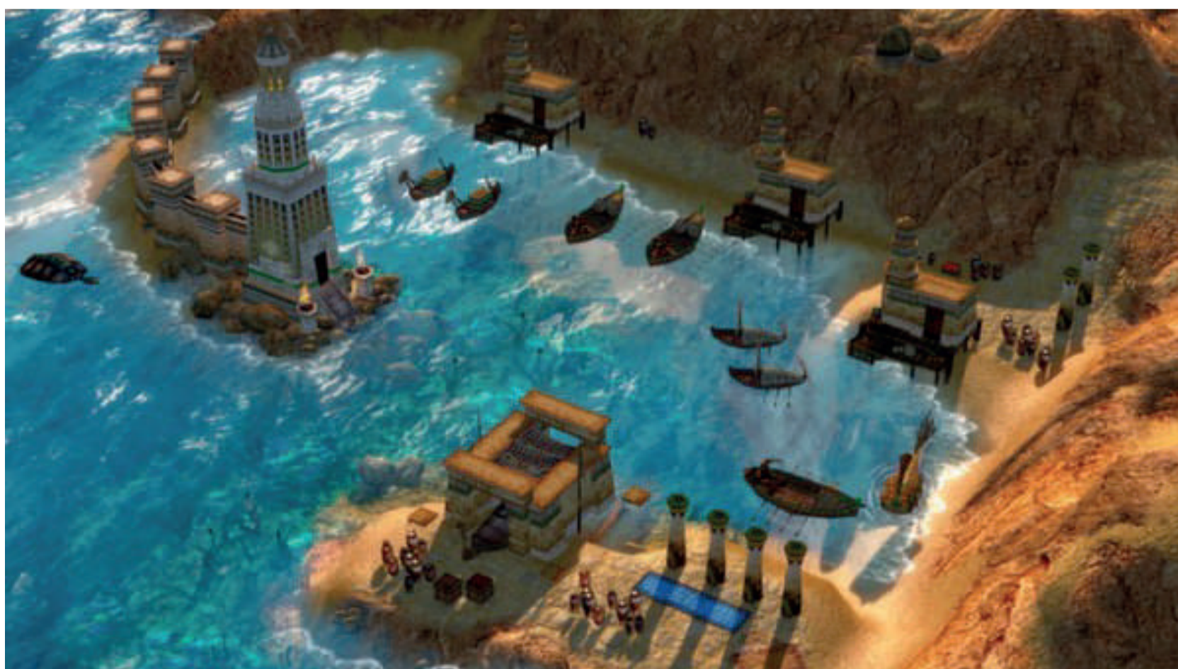
Age of Mythology, Bruce Shelley, Ensemble Studios, Skybox Labs, 2002

Es un videojuego que recrea el inicio de una sociedad. Cuenta con campañas, ejércitos, edificios, poderes divinos. Está planificado para realizar combates en todo tipo de terrenos, mientras se hace progresar una sociedad controlando recursos agrícolas, materiales primas y oro.